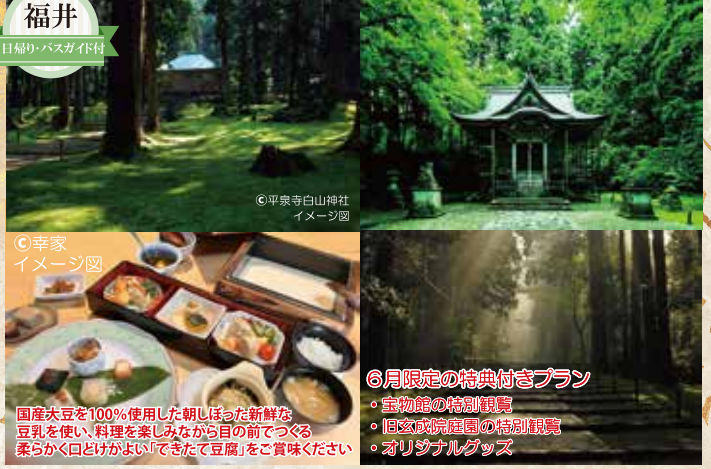
◎平泉寺白山神社 イメージ図