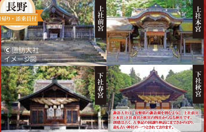
◎諏訪大社 イメージ図